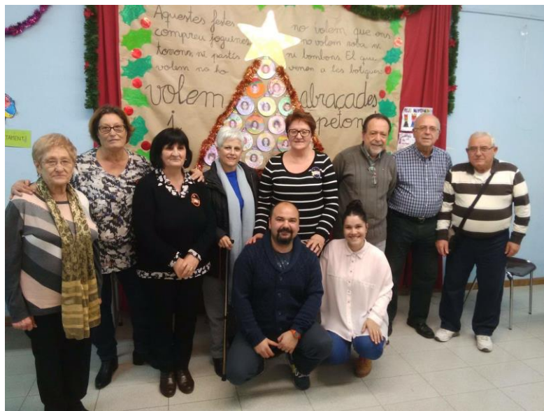
Fotografia de la Assemblea General de socis realitzada el passat 16 de desembre de 2015.

Des d'aquestes línies i en nom de tots els membres de la Junta Directiva, volem animar-vos a participar en les diferents activitats, xerrades, tallers, jocs, sessions lúdiques... que tindran lloc durant aquesta setmana i que estan directament relacionades amb les noves tecnologies.