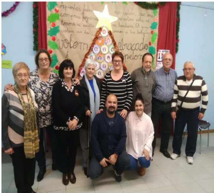
Membres Junta Directiva

Durant l'any 2015 hem celebrat els 25 anys d' Associació de Veïns Pius XII-Germanor .